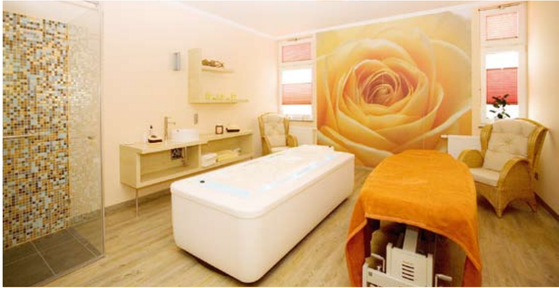
„Rosenzimmer“ mit Softpack-Wasserbett und Massageliege