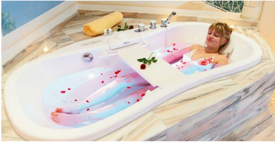
Wellness-Klangwanne mit Farblichttherapie