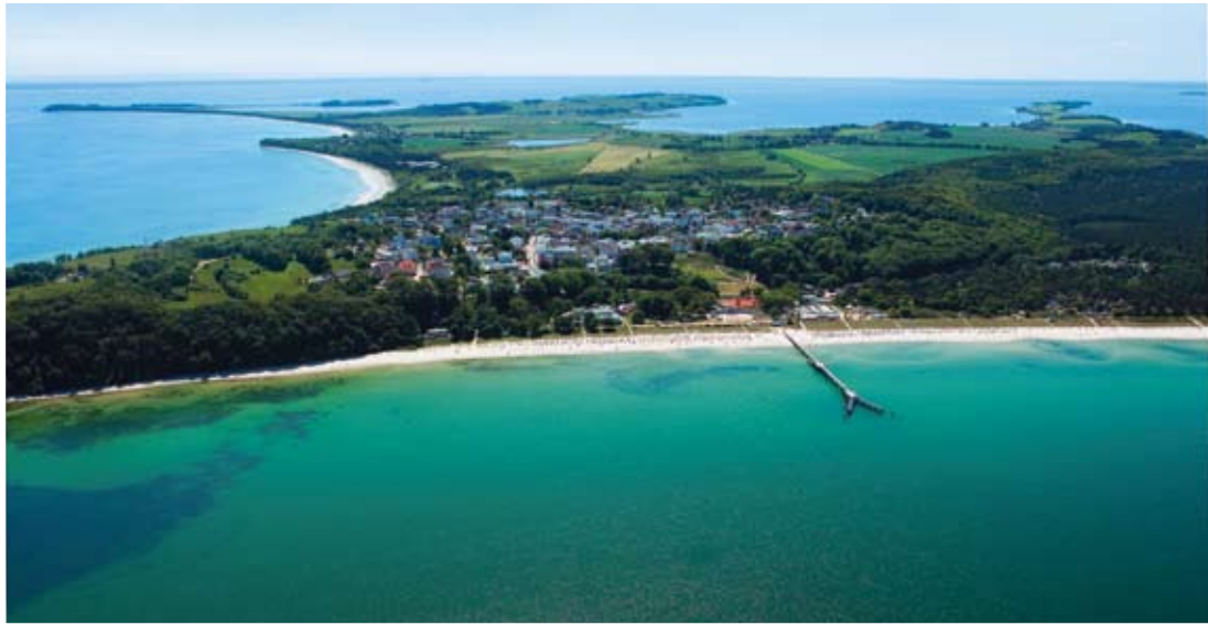
Ostseebad Göhren – traumhafte Lage