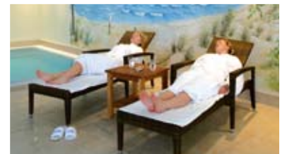
einfach nur entspannen