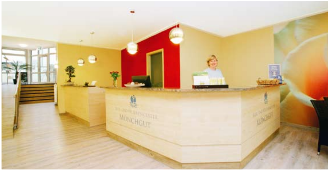
Empfang / Rezeption vom Kneipp-Kur & Wellnesscenter