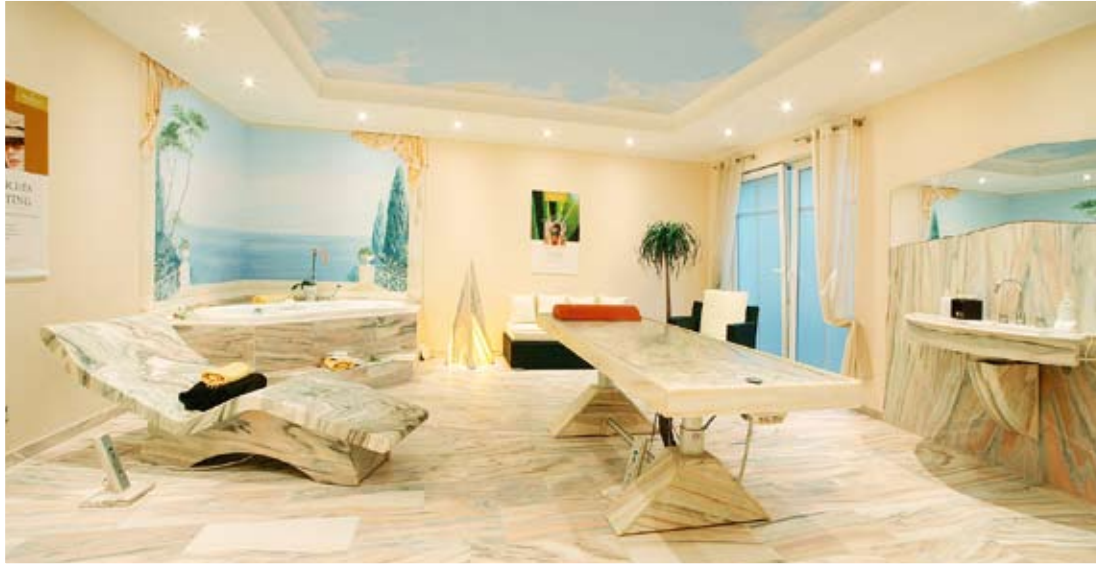
„Marmorzimmer“ mit beheizbarer Marmorliege und Massagetisch