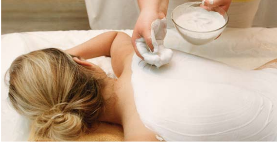
Rügener Heilkreide – ein Naturprodukt