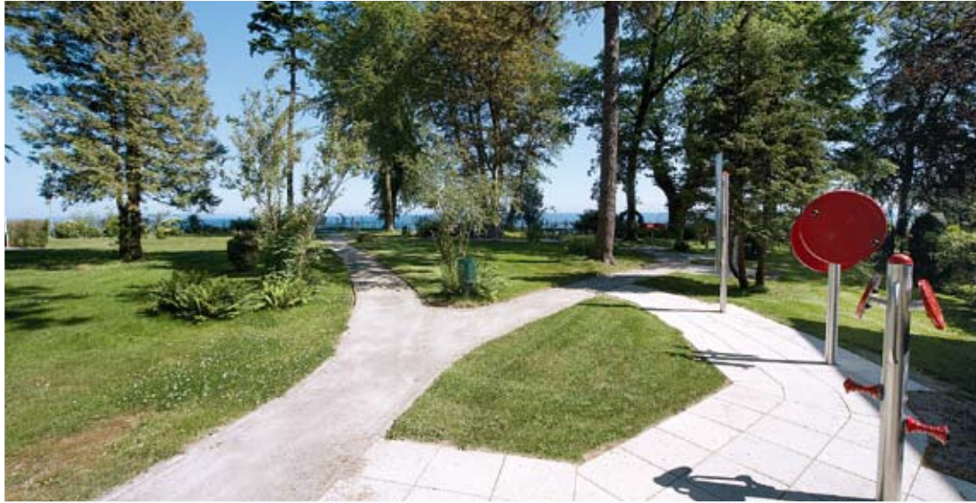
Fitness-Park mit Meerblick