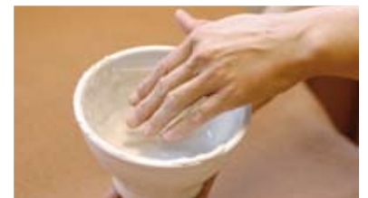
Anwendung Rügener Heilcreide