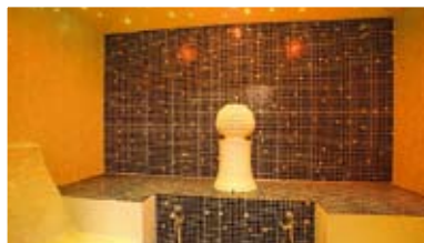
Rasulbad / Kreideschlammbad