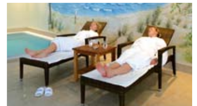
einfach nur entspannen