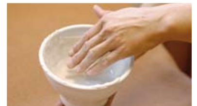
Anwendung Rügener Heilkreide