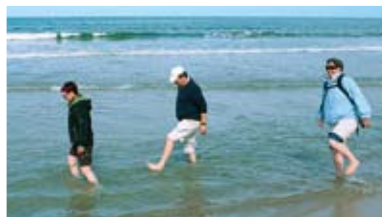
Größtes Kneippbecken: die Ostsee