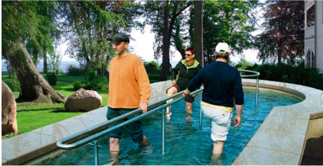
KNEIPP-Tretbecken im Park