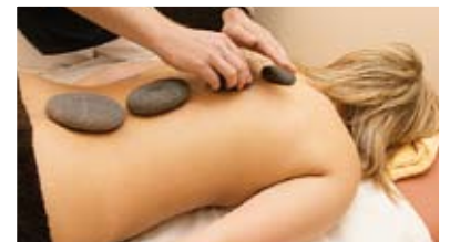
La Stone - Kraft heißer Steine